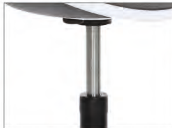
Gasfederhöhenverstellung von 54 bis 69 cm oder von 63 bis 89 cm