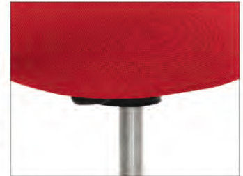
EB S2: Elastomer im Standfuß und im Sitz