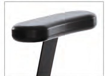
Modell 3810, Pad mit Stahlfeder