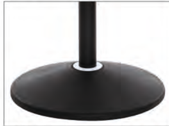
EB S1: Elastomer im Standfuß